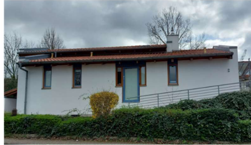
Krippe Paul-Gerhardt-Str. 2 31157 Sarstedt