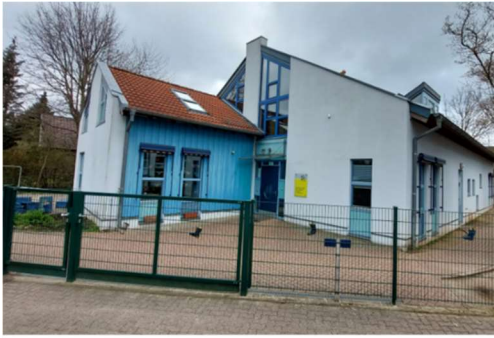
Kindergarten Carl-Orff-Weg 3 31157 Sarstedt